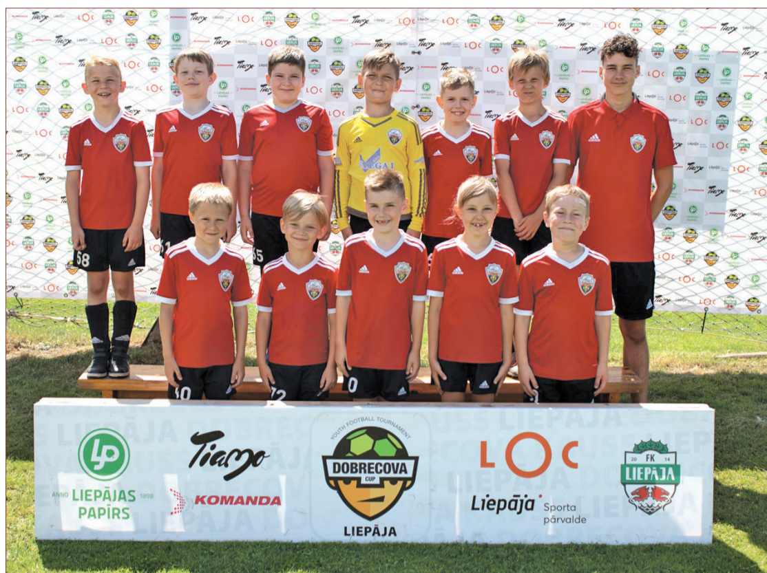
U-8 spēlētāji Dobrecova kausā.

27.07. Nīcas svētku ietvaros notiks „Nīcas karaļa un karalienes” sacensības pludmales volejbolā.