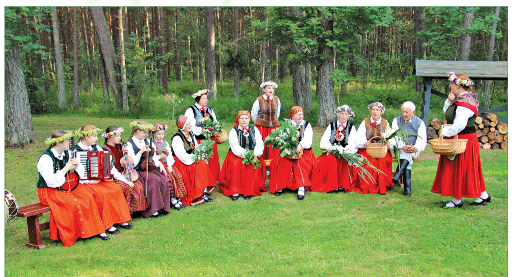
Apmeklētājus Bernātos ar dziesmām un stāstiem sagaida Otaņķu etnogrāfiskais ansamblis.

Vakara noslēgumā, sadarbībā ar biedrību „Mēs Bernātiem”, sanākušie baudīja brīvdabas kino vakaru, kas šajā vasarā bija pirmais, bet noteikti ne pēdējais.