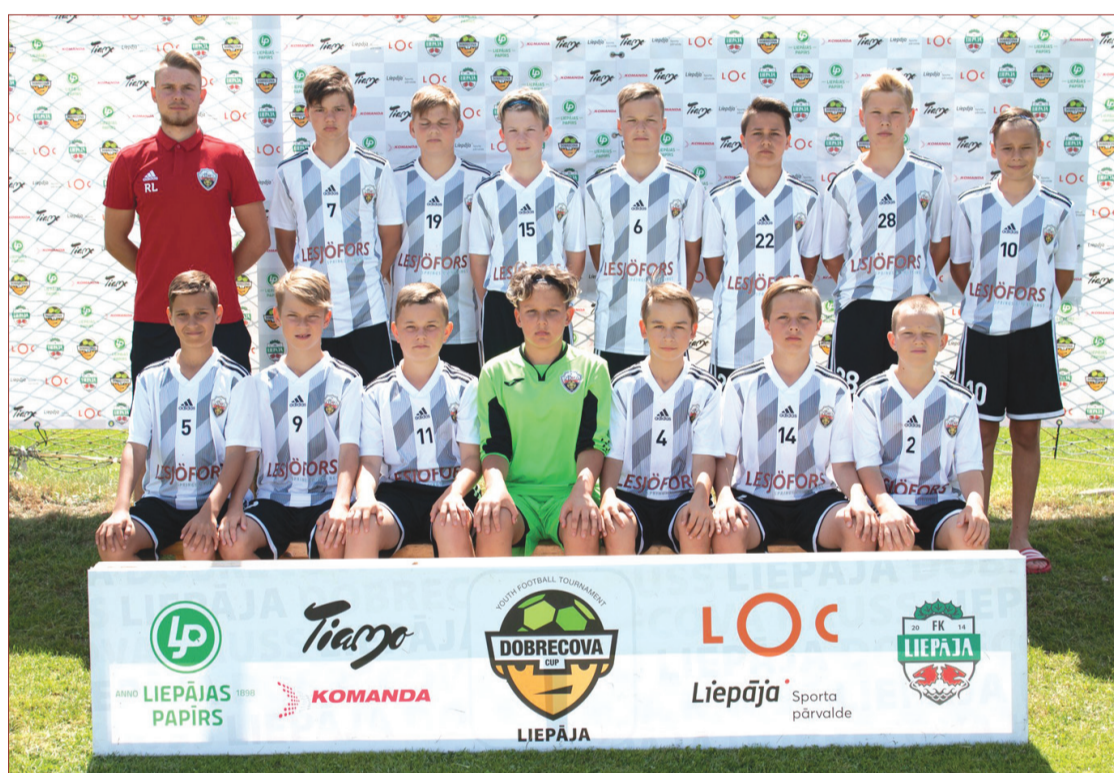
U-13 spēlētāji Dobrecova kausā.