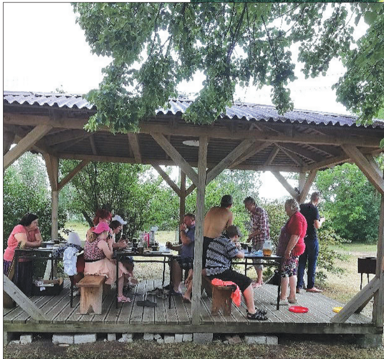
Tradicionāli viesi tiek cienāti ar gardajām jūrmalciemnieču pankūkām.